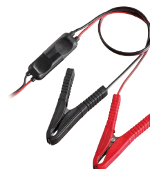
SM C36L - C36LT