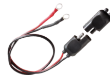
SM C36L - C36LT